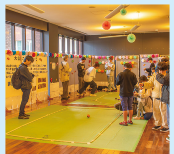
大山こま回し体験