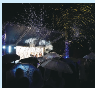
グランドフィナーレ