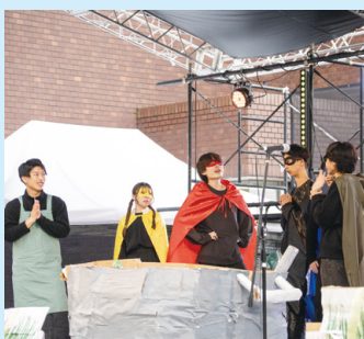
子供のための野菜劇(松岡ゼミ)