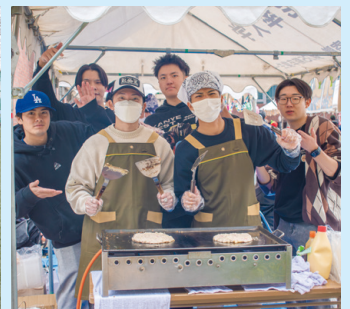
模擬店(お好み焼き)