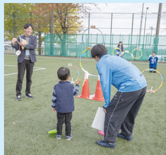
中川ゼミSANN0 SPORTS PARK