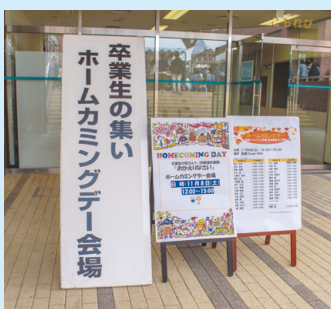
ホームカミングデー