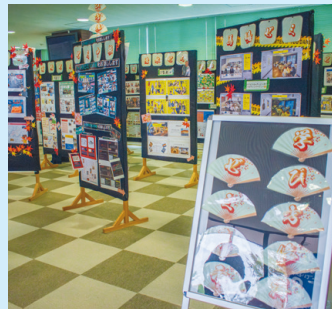
学び方修得ゼミの展示