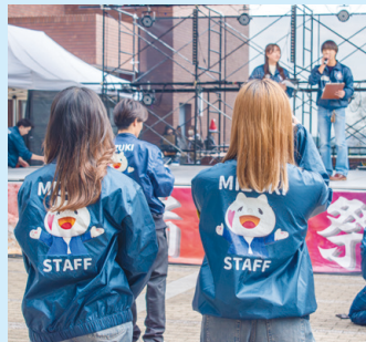
司会を見守る瑞木祭スタッフ