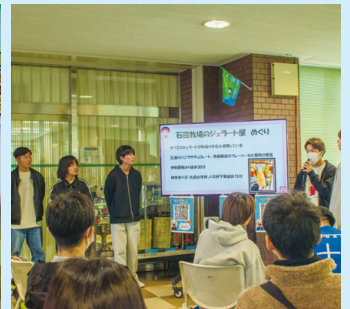
学び方修得ゼミの発表