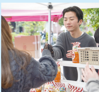
模擬店(ポップコーン販売)