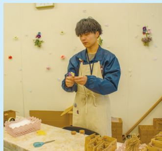
校友会企画ドライフラワー作り