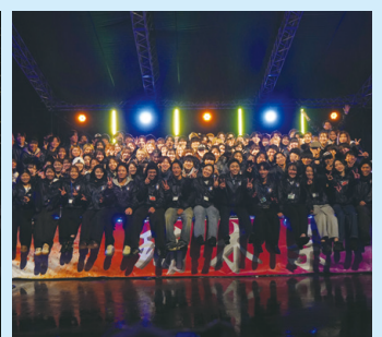
瑞木実行委員会メンバー大集合