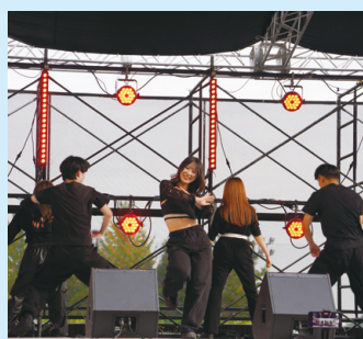
サークルSDCのダンス